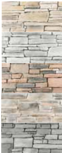
Ton pierre TA-1K