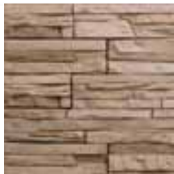
Ton beige : 401