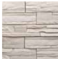
Ton blanc : 100