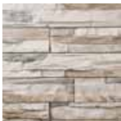
Ton pierre : 101