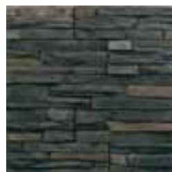
Ton gris : 311